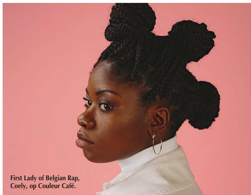
First Lady of Belgian Rap, Coely, op Couleur Café.

Geen enkele talkshow ter wereld is zo magnifiek doordrenkt van muziek als The Tonight Show met Jimmy Fallon. De vaste begeleidingsband van die televisietalk-